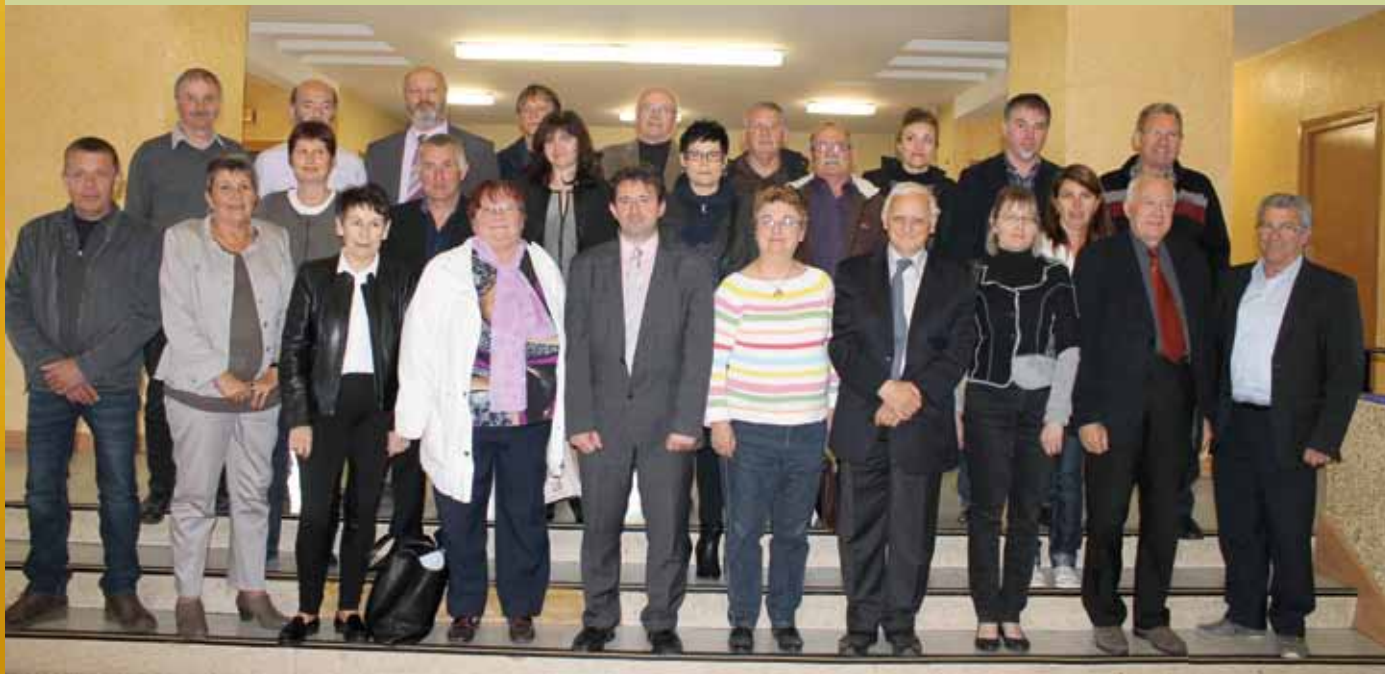
Attention sur cette photo il manque M. Dominique PEDUZZI, 5ème vice-président (Fresse Sur Moselle).

Cet article reprend succinctement les comptes-rendus du conseil communautaire. Les comptes-rendus complets sont disponibles aux locaux de la Communauté de Communes ou sur le site internet de la collectivité.