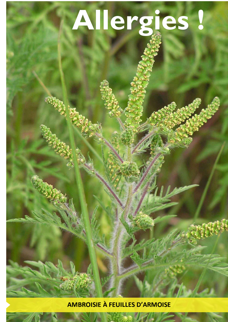
AMBROISIE À FEUILLES D'ARMOISE