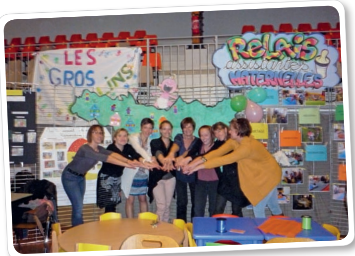
Journée de la Parentalité.

Les familles ont également pu partager de nombreuses animations avec leurs enfants dans la bonne humeur ! Un grand merci à toutes les équipes des structures qui ont participé à cette action collective et qui ont œuvré avec dynamisme.