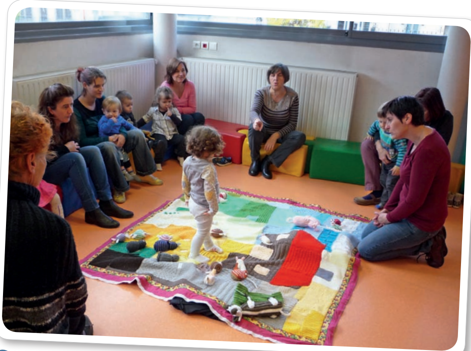
Atelier raconte-tapis à la Médiathèque du Thillot.

Il permet également de rompre l'isolement pouvant parfois être ressenti par les assistants maternels en leur permettant de se retrouver régulièrement ensemble et d'échanger leurs pratiques éducatives.