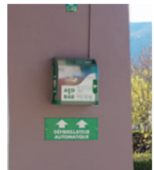
SAINT - MAURICE - Mairie