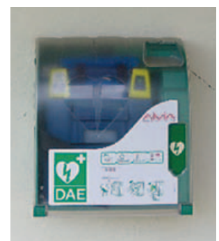
FRESSE - stade camping