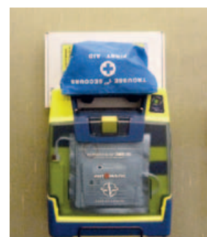
FRESSE - Mairie