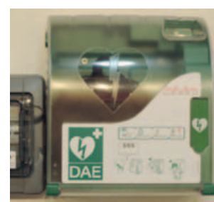
RUPT/MOSELLE Mairie, gymnase, dojo et salle socioculturelle