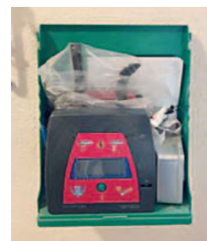
RAMONCHAMP - Stade