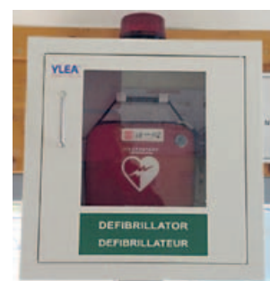
FERDRUPT - Mairie