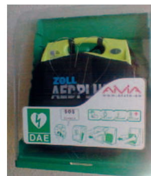
LE THILLOT Salle Omnisports

Les photos qui servent d'illustrations ne sont que quelques exemples d'endroits où on peut trouver des défibrillateurs Des applications smartphones existent qui les recensent.