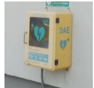
BUSSANG - Mairie