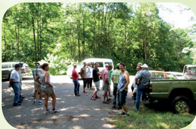
Visite Le Ménil