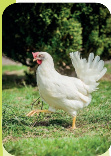
En moyenne, chaque poule a ingurgité l'équivalent de 53 kg par an.

Un bilan « un an plus tard », fin 2016 donc, permettra de savoir si les familles ont agrandi leur élevage, convaincu leurs voisins ou adopté de nouveaux gestes pour réduire (encore) le poids de leur poubelle.