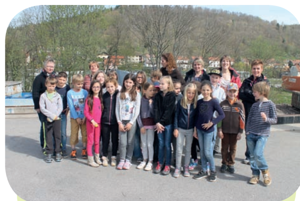
Classe de CE2 de Fresse sur Moselle

Pour plus de renseignements, ils peuvent nous contacter au 03.29.62.05.02.