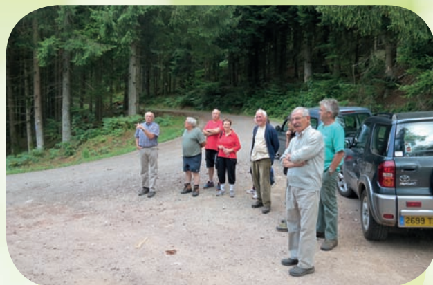
Visite Le Thillot

L'étude de la deuxième phase du Plan de Paysage de la Communauté de Communes des Ballons des Hautes Vosges a débuté il y a un an. Son objectif est de mettre en valeur notre cadre de vie et de tirer le meilleur parti possible des multiples attraits de l'ensemble de notre territoire, pour le rendre attractif et pour contribuer à sa vitalité économique.