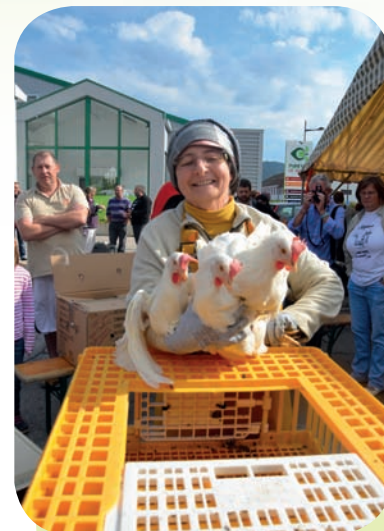
Les poules fournies étaient issues d'élevages vosgiens.