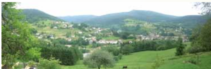
Vue sur Saint Maurice sur Moselle