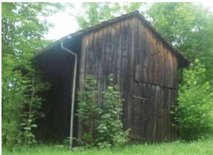
Petite cabane servant d'abri à foin, appelée « grangette » («gringeotte» en patois). Fresse sur Moselle