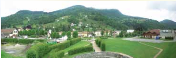
Vue sur Bussang

Le plan de paysage vise à anticiper l'évolution paysagère d'un territoire pour préserver son identité et valoriser des atouts. Ce document sera la transcription d'un projet de devenir du paysage commun à tous les acteurs et utilisateurs de l'espace.