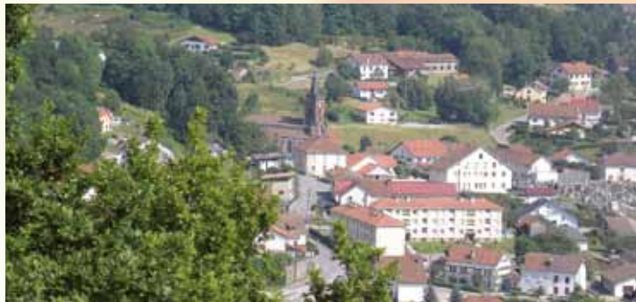
Vue du Centre bourg Fresse sur Moselle