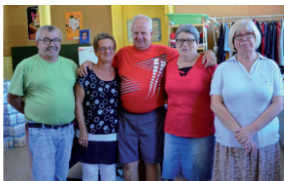
Bénévoles au centre de Saint Maurice