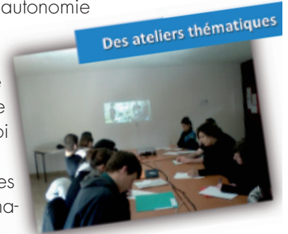
Des ateliers thématiques