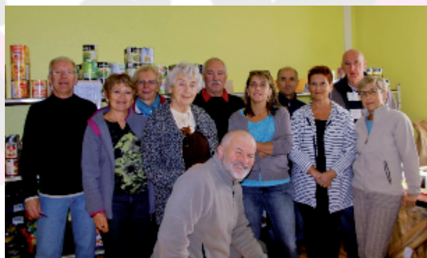
Bénévoles au centre de Ramonchamp

Pour effectuer toutes ces tâches, le centre de Saint Maurice sur Moselle a besoin de personnes disponibles pour devenir bénévoles ayant en particulier des compétences pour l'utilisation des outils informatiques (traitement de texte, tableur, navigation internet, messagerie...), possédant également un moyen de locomotion.