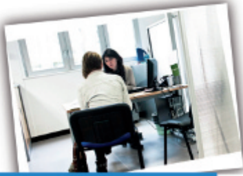
Un accompagnement individualisé