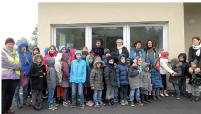
Photo de la visite

Le mercredi 14 octobre 2015, 36 enfants de 4 à 10 ans, dans le cadre des Nouvelles Activités Périscolaire de Dommartin-lès-Remiremont, sont venus visiter la déchèterie de RUPT SUR MOSELLE. Ils ont pu voir comment fonctionnait un site tel que celui-ci, et recevoir des explications sur le tri, le compostage et le devenir des déchets.