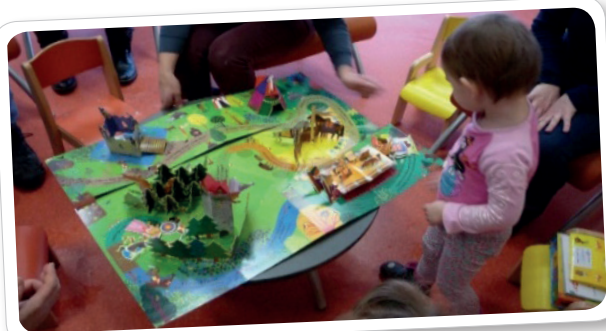
Découverte du Moyen Age