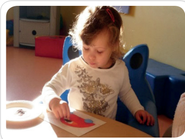
Création d'une voiture en sable coloré