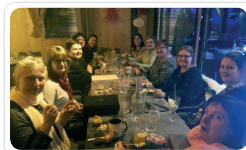
Soirée au Restaurant... Bussang et Le Ménil