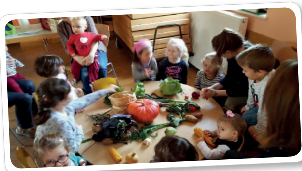
Sensibilisation à l'alimentation