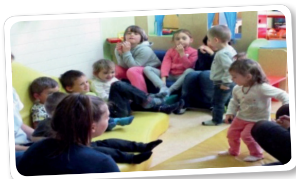
Rencontre avec les enfants de la crèche les « Gros Câlines » de Rupt-sur-Moselle