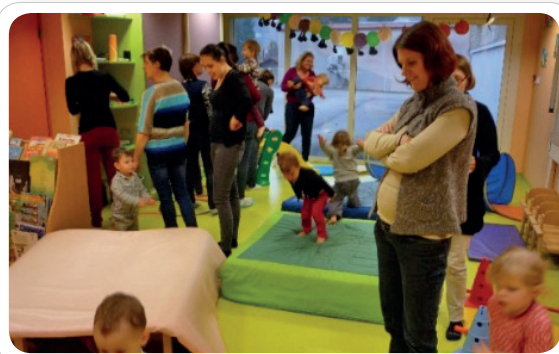
Parcours de psychomotricité au Multi-Accueil « Chantelune » de Ramonchamp