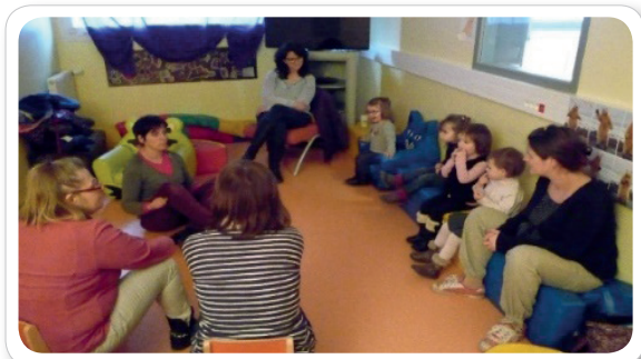
Comptine de présentation avant de conter les histoires