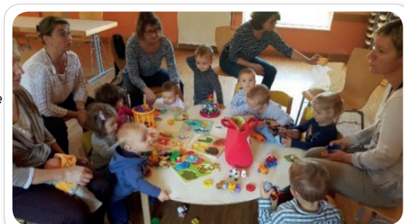
Importance des jeux libres